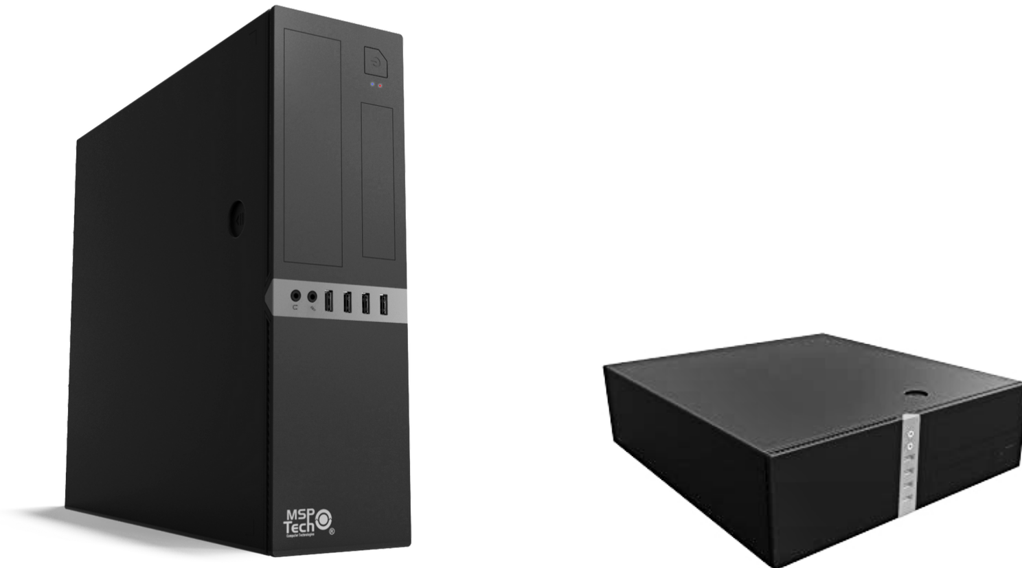
Tabla de Especificaciones